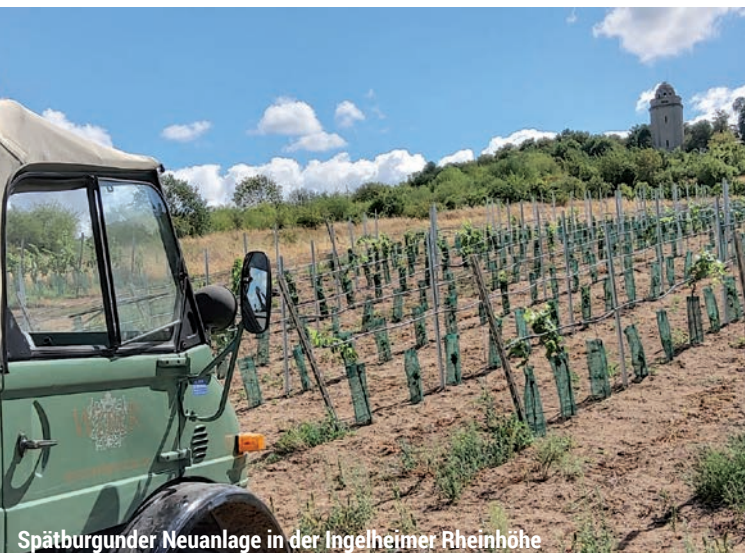
Spätburgunder Neuanlage in der Ingelheimer Rheinhöhe