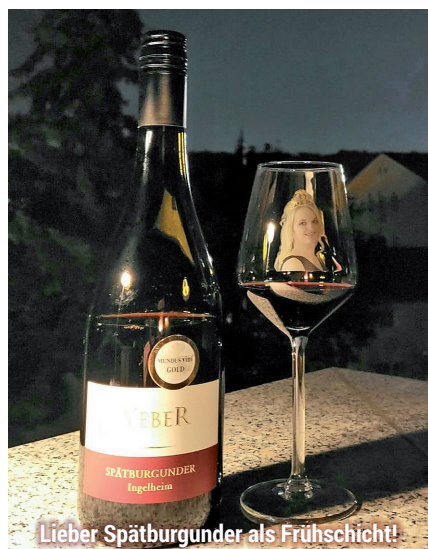
Lieber Spätburgunder als Frühschicht!